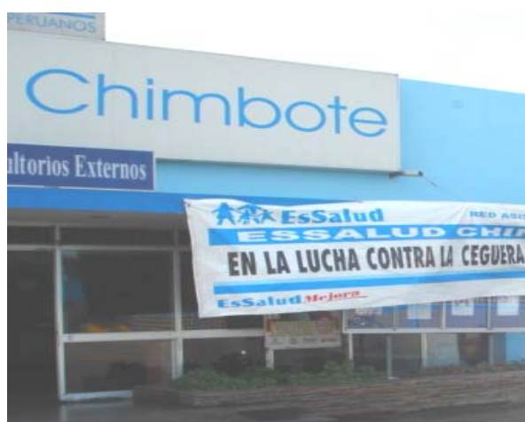
Figura 1. Hospital III EsSalud de Chimbote.

El presente estudio tuvo como objetivo determinar la prevalencia, características clínicas, funcionales y socioeconómicas del anciano frágil mayor de 75 años en el Hospital III EsSalud de Chimbote entre octubre 2006 y abril 2007.